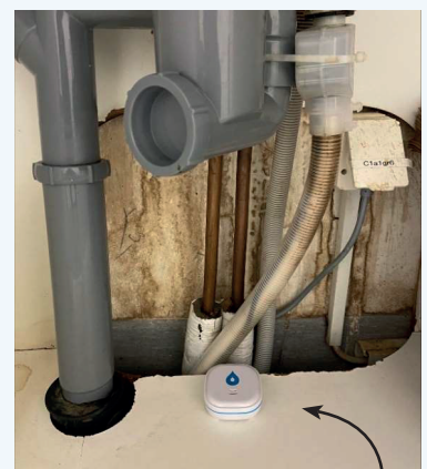
PLACERA VATTENLARMET SÅ HÄR.

I samband med stambytet i er bostad är det viktigt att ni tar bort vattenlarmet innan stambytet påbörjas, detta så att larmet inte försvinner. När stambytet är färdigt lägger ni tillbaka vattenlarmet under diskhon.